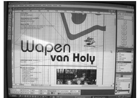
(foto: het eerste wapen werd nog gestencild, nu gaat het allemaal op de computer)

En daar is dan weer niets in veranderd in de loop van de jaren!!!